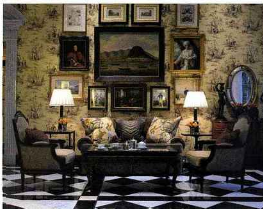
DE HAUT EN BAS ET DE GAUCHE A DROITE LE GRAND GENRE DU FOUR SEASONS GRESHAM PALACE DE BUDAPEST LE CHARME DE LA SIGNORIA A CALVI LE NOUVEAU SPA DU SAADI 3 000 M 2 DE BIEN-ÊTRE THE SAVOY , UNE LEGENDE LONDONNIENNE

A partir de 300 euros, www.fourseasons.com/budapest . Budapest est desservi quotidiennement par Malev. www.malev.com En avril, Directours propose un week-end 3 jours/2 nuits au Gresham à partir de 509 euros par personne incluant les vols et petits déjeuners. www.directours.com