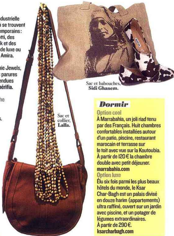
Sac et collier, Lalla.

Un sac, une pochette ou un chèche chez Lalla ("madame" en arabe), dont les merveilles créées avec du tissu rétro s'exportent à Londres. Souk Chérifia. lalla.fr