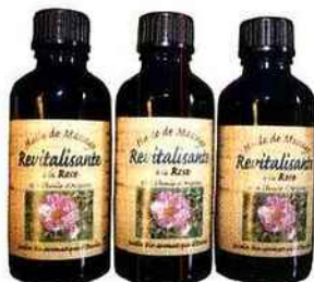
Huile de massage à la rose, Nectarome.

Une tisane au premier jardin bio aromatique du Maroc, dans la vallée de l'Ourika. Bonus : les conseils pour se soigner 100 % bio et les huiles essentielles certifiées Ecocert. nectarome.com