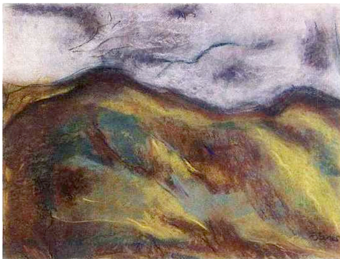
Françoise Jones (née en 1947), Sans titre , pastel, 49,5 x 64,5 cm, galérie-atelier Florence Berger, Paris XIV e , du 8 au 16 octobre.

Du 9 au 11 octobre , les 9 et 10 octobre, 15 h-21 h ; le 11 octobre, 15 h-18 h, palace Es Saadi, rue Brahim el Mazini, Hivernage, Marrakech, Maroc, www.marrakechartfair.com