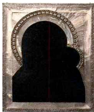
Alexander Kosolapov (né en 1943), Idône au caviar , 2008, galerie Vallois Sculptures, Paris VI e , jusqu'au 30 octobre.

Dans le cadre de sa programmation russe, la galerie consacre un one-man show à l'artiste moscovite Alexander Kosolapov, dont elle n'avait pas exposé le travail depuis 2007. Une vingtaine d'œuvres inédites, réalisées entre 2008 et 2010, composeront cette exposition : sculptures, tableaux et photographies. Kosolapov adhère au mouvement « Sots Art » (contraction d'art et socialisme), dès sa création en 1972. Héritier du mouvement dada, pop art rouge, le Sots Art se nourrit de l'iconographie propagandiste du régime communiste : Marx, Lénine, Staline... Contraint à la fuite vers les États-Unis en 1975, l'artiste enrichit son travail du langage publicitaire américain : Mickey, McDonald's, Coca-Cola, marques notoires de la société de consommation. Sa récente produc-