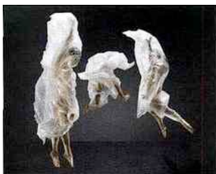
Répétition du ballet créé par Angelin Preljocaj, théâtre du Bolchoï