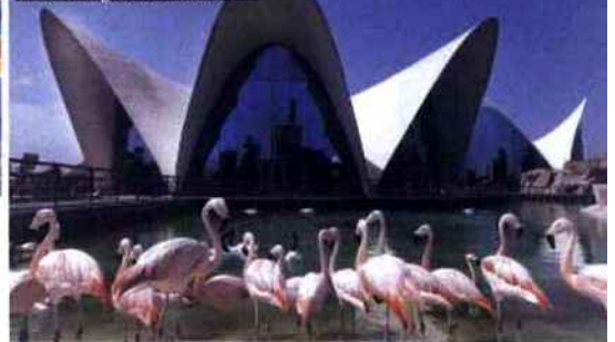
Comme un nénuphar posé sur l'eau, l'Océanogràfic à Valence...

On dort où ? Au Patio en Santa Cruz, un hôtel à la très belle terrasse (à partir de 68 €, 128 € pendant la Semaine sainte).