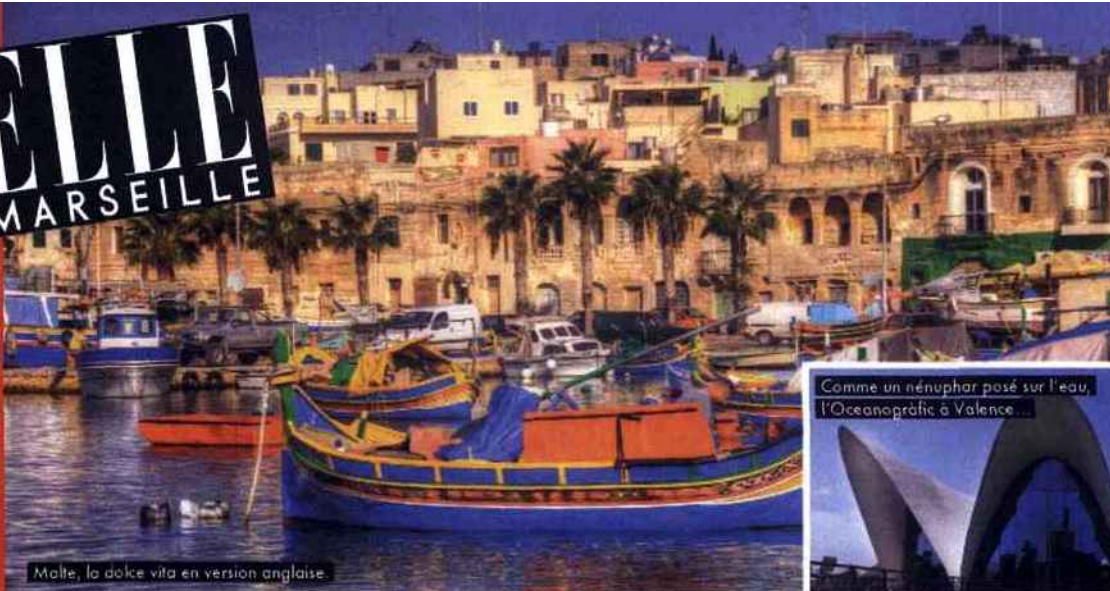
Malte, la dolce vita en version anglaise