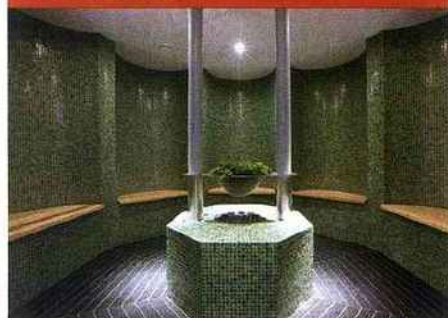
Réalisation Lauriane Seignier.

C'est comment ? Spectaculaire. Ce spa de 3 000 mètres carrés attenant au Palace Es Saadi est construit autour d'un imposant eucalyptus centenaire. Marbre, tadelakt, zellige... les traditions marocaines et le faste oriental nous envoûtent immédiatement. On y va pour ? S'immerger une bonne demi-journée avec, au programme, un massage (conçu en exclusivité par le kinésithérapeute Gil Amsellem) qui mêle des techniques manuelles du monde entier ; un soin visage anti-âge signé Dior ; et, à l'Oriental Thermae, un parcours incroyable de bains de vapeur avec fontaine de glace pour se revigorer entre chaque salle. Palace Spa Es Saadi Marrakech, Maroc. www.essaadi.com