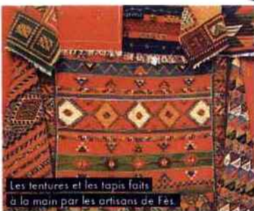
Les tentures et les tapis faits à la main par les artisans de Fès.