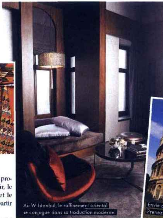
Au W Istanbul, le raffinement oriental se conjugue dans sa production moderne.

On ne rate pas : la visite de Meknes, à 50 km de Fès, et bien moins chère. On négocie de meilleurs prix en flânant dans les boutiques, comme L'Art des villes impériales qui propose un joli choix de damasquineries (gravure sur objets de déco en acier) et de tapis berbères fait main, vraiment superbes. ■ 2, Derb Hammam Moulay Ismail, Meknes. Tél. : (+212) 035 55 37 40.