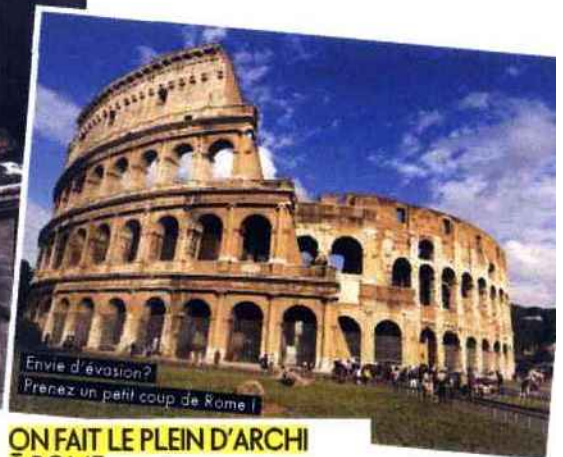
Envie d'évasion? Prenez un petit coup de Rome!

■ 48, Akaretler. Tél. : (+90) 212 227 44 04. www.istanbuldoors.com