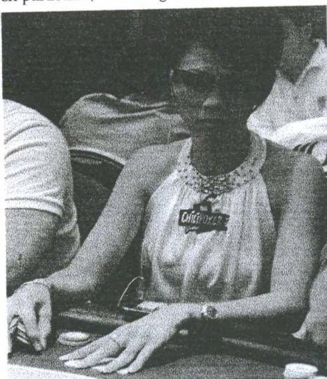
L'Américaine Liz Lieu, star du poker, qui a remporté plusieurs tournois du WPT.