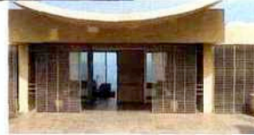
La Réserve à Ramatuelle