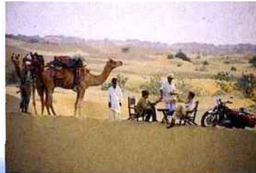
Halte en Inde