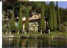
Villa d'Este face au lac de Côme