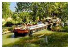
L'Appart des anges

Laissez-vous voguer le long des rives du Canal du Midi à bord de l' Appart des anges : sur cette péniche Freycinet de 40 mètres, les trois cabines ont été aménagées avec goût. Sur le pont : des terrasses et une piscine avec vue sur le canal et les vignobles. Atmosphère tout aussi bucolique à bord du Boudoir de Serendipity , amarré à Asnières. Cette péniche, qui mélange art industriel et mobilier chiné, offre le même confort qu'un hôtel.