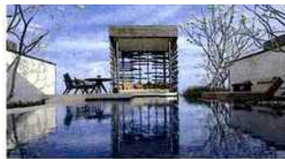
Alia Villas Utuwatu à Bali