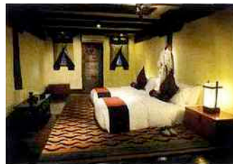
Banyan Tree Ringha, en Chine

A l'abri des regards, le Pavillon de la Reine est ancré place des Vosges. Ici, le bonheur se cache dans un soin au spa, suivi d'une nuit dans une des suites inspirées par l'histoire du Marais. Toujours à Paris, la suite Eiffel «classique» du Plaza Athénée promet une vue sur la Dame de Fer, grâce à une baie vitrée conçue comme un cadre argenté. Autre havre de paix : le Couvent des Minimes , entre Luberon et Haute-Provence. Les 46 chambres et suites, au milieu d'un parc de cyprès et d'oliviers, sont surnommées «bulles de bonheur». Le charme un brin désuet de La Mirande , en Avignon, vaut lui aussi le détour avec sa table d'hôtes dressée dans une cuisine XIX e . Même sensation d'apaisement dans l'un des 262 Relais du silence en Europe. Et plus lointains : l' hôtel Banyan Tree Ringha , à 3200 mètres d'altitude dans la province du Yunnan, en Chine. Ou encore le ryokan Nishiyama de Kyoto, épuré à l'extrême.