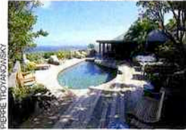
Villa Nahma à Saint Barth