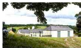
Chez le Prince Charles en Cornouailles