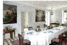
Le Domaine de Kerbastic, près de Lorient