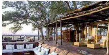
Dans un lodge au Mozambique