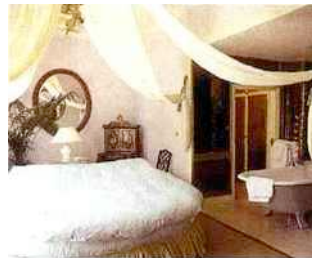
Hôtel Portobello à Londres