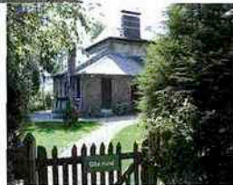
Un gîte de l'Office national des forêts