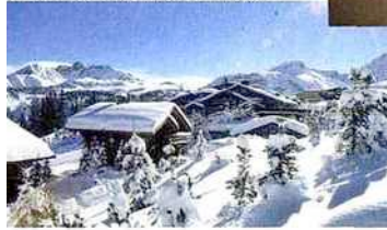
Châlet Sotheby's à louer à Megève