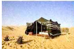
Bivouac dans le Sultanat d'Oman

On se sent comme chez soi chez Pascal et Pascal , à Paris, rue de la Folie-Méricourt. Ici, déco colorée, cuisine équipée et confitures « maison » au petit-déjeuner. Ambiance tout aussi sympa au Sourire de Montmartre . Dans ce triplex, on voyage dans chaque chambre : en Asie dans la chambre Zen , au Maroc dans la Marrakech et dans le temps avec la Joséphine . Pour les embruns en plus, rendez-vous au Chemain des îles , à l'Île-aux-Moines : avec espace bien-être et table d'hôtes 100% bio.