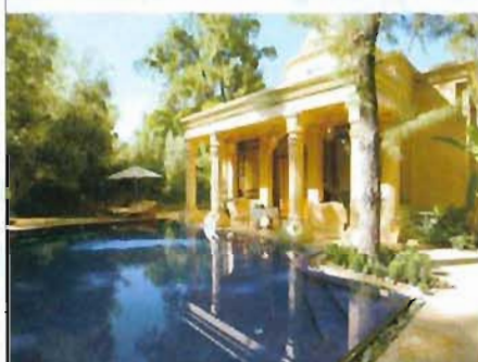
La Mille et une nuit. De jour.