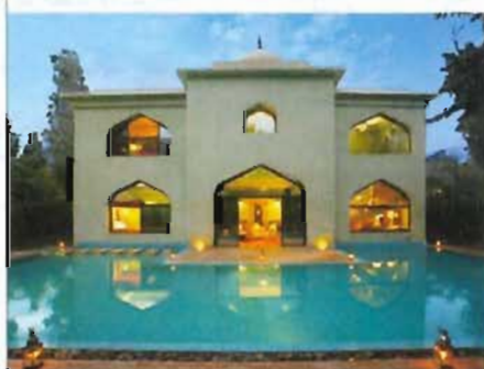
La Maharaja au crépuscule.