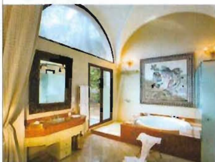
Spa... ou therme à la romaine.