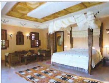
Luxe et tradition : la villa berbère.