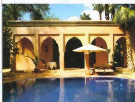
La sobriété extérieure de la Sultane.